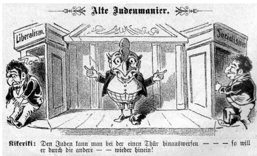
Antisemitische Karikatur des „Kikeriki“ (1896): Viele Juden treten der jungen Sozialdemokratie bei

Hauptkriterium für den Zusammenschluss der Mitglieder des Abgeordnetenhauses zu Klubs – die auch damals, lange vor ihrer geschäftsordnungsmäßigen Verankerung schon eine wesentliche Rolle in der parlamentarischen Wil-